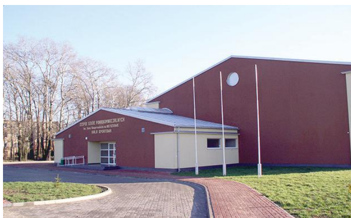
Wniosek zakłada modernizację elewacji sali sportowej przy Zespole Szkół Ponadpodstawowych im. Jana Kasprzowicza w Nietążkowie.