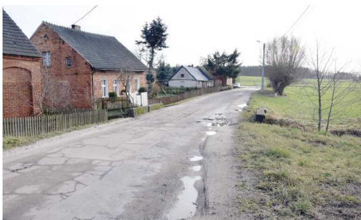
Na terenie gminy Śmigiel wnioskodawcy planują remont drogi w Robaczynie.