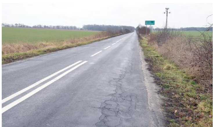
Planowany jest remont ponad 4 km drogi na terenie gminy Kościan i Krzywiń.