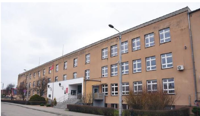
W Zespole Szkół Ponadpodstawowych im. Franciszka Ratajczaka w Kościanie planowany jest m.in. remont kotłowni i wymiana kotłów grzewczych.