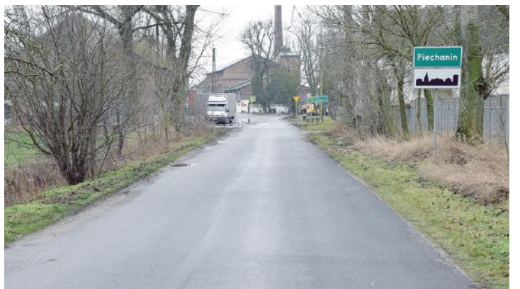
W gminie Czempień planowana jest inwestycja drogową na odcinku Piechanin – Srocko Wielkie.