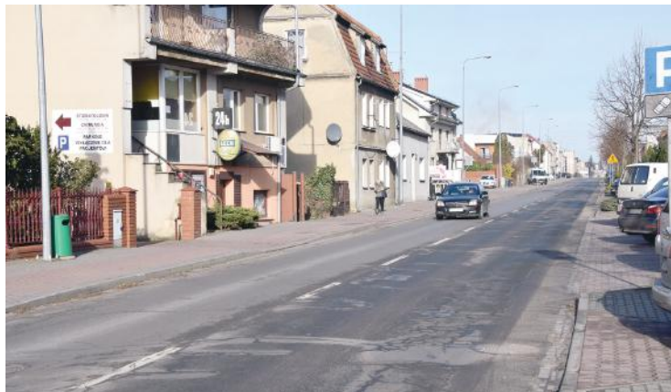
W złożonym wniosku samorząd powiatowy planuje remont ulicy Poznańskiej w Kościanie.

Łącznie w tych trzech złożonych wnioskach Powiat Kościański ubiega się o wsparcie w wysokości 23 816 500 złotych. bj