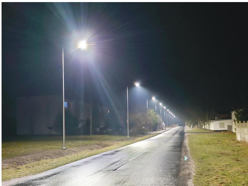
Osiek z nowym oświetleniem ulicznym

Obecnie w Gminie Kościan mamy około 1000 opraw typu LED wkomponowanych w oświetlenie naszych ulic i dróg, a do wymiany pozostaje jeszcze ok. 700 opraw starego typu, będącego własnością spółki ENEA Oświetlenie. (md)