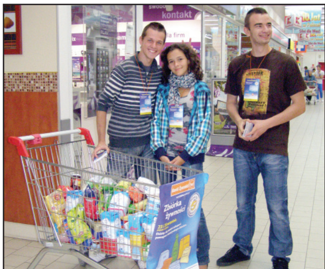
Pracownicy Zespołu Szkół im. Marii Konopnickiej oraz wolontariusze ze szkół ponadgimnazjalnych w Kościanie zebrali ponad tonę artykułów spożywczych, z których zostały przygotowane paczki dla dzieci potrzebujących pomocy.

Więcej szczegółów na temat samej imprezy, zasad startu, jej organizatorów i sponsorów znajdziecie Państwo pod adresem : www.sanakoscian.pl/polmaraton/ bj