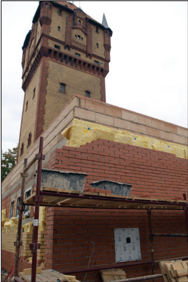
Wieża ciśnień z dobudowywanym zapleczem adaptowana jest na obiekt rekreacyjny z obserwatorium astronomicznym i ścianą wspinaczkową