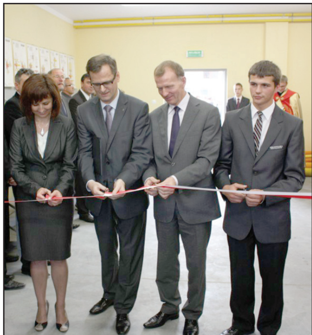
Nowa pracownia dydaktyczna wyremontowana została za 115 tys. złotych. Środki pochodziły z budżetu Powiatu Kościańskiego. Wyposażenie sali ufundowała Wielkopolska Spółka Gazownictwa.

Na koniec uroczystości prezes Wielkopolskiej Spółki Gazownictwa wręczył dyrektorze szkoły ufundowanego przez spółkę laptopa oraz rzutnik multimedialny. bd