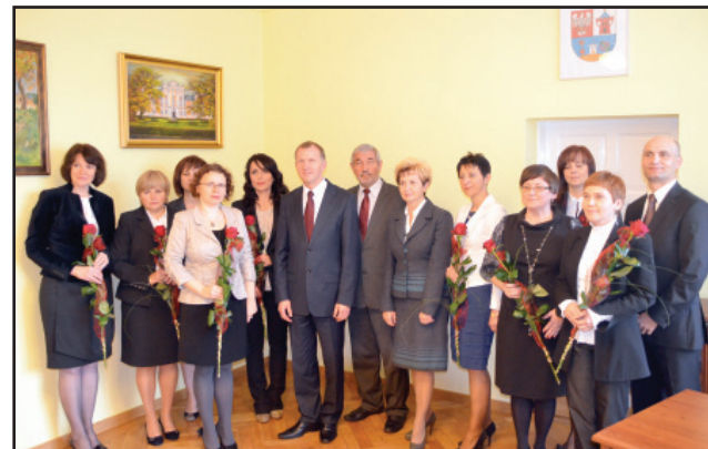
Starosta Kościański przyznał nagrody wyróżniającym się pedagogom pracującym w Poradni Psychologiczno – Pedagogicznej i szkołach prowadzonych przez powiat.