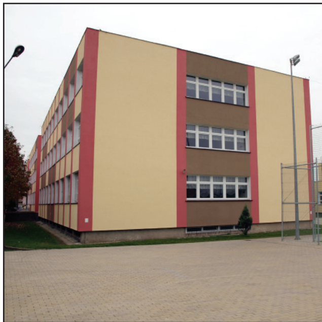
Zbliża się ku końcowi inwestycja termomodernizacji Zespołu Szkół nr 3 w Kościanie

Samorząd Kościana dofinansowuje również przebudowę dróg z terenu miasta, które wykonuje powiat kościański: kwotą 550 tys. zł zadanie przebudowy ul. Łąkowej i Północnej, a kwotą 925 tys. zł - przebudowy Al. Koszewskiego i ul. Sierakowskiego.