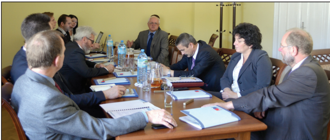
Podczas spotkania rozmawiano o możliwościach podjęcia współpracy przy budowie systemu informacji przestrzennej.

Pracownicy firmy Systherm-Info z Poznania zaprezentowali uczestnikom spotkania stworzony przez firmę program, na którego bazie mógłby powstać w powiecie system informacji przestrzennej. Podobne rozwiązania funkcjonują np. w powiecie wrocławskim. bj