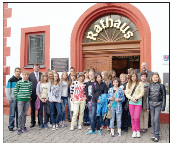
Pamiątkowe zdjęcie grupy młodzieży i szefów samorządu z Kościana pod Ratuszem w Schmalkalden