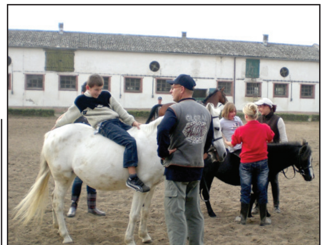
Hipoterapia to dla dzieci niezapomniana przygoda.