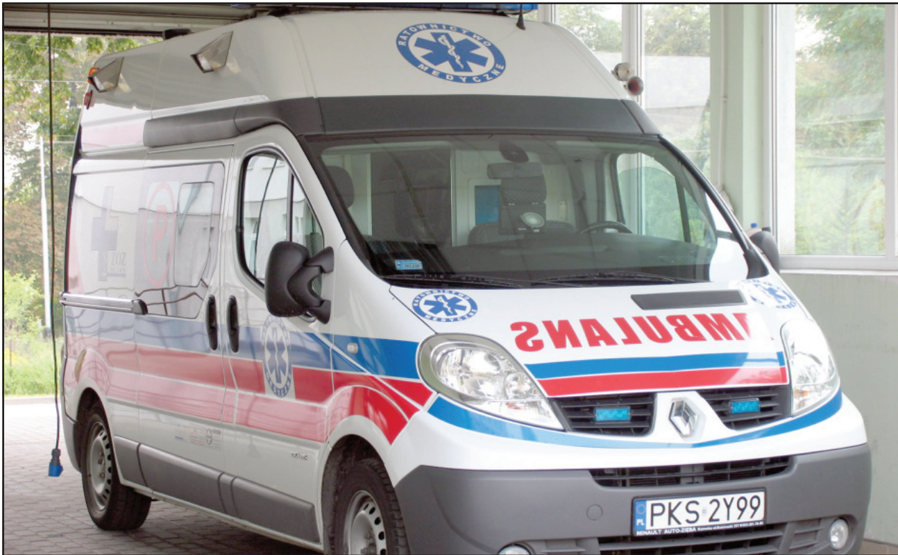
Starosta kolejny raz, przy poparciu mieszkańców zwrócił się do ministra zdrowia z prośbą o zgodę na utworzenie w powiecie 3 zespołu ratownictwa medycznego.