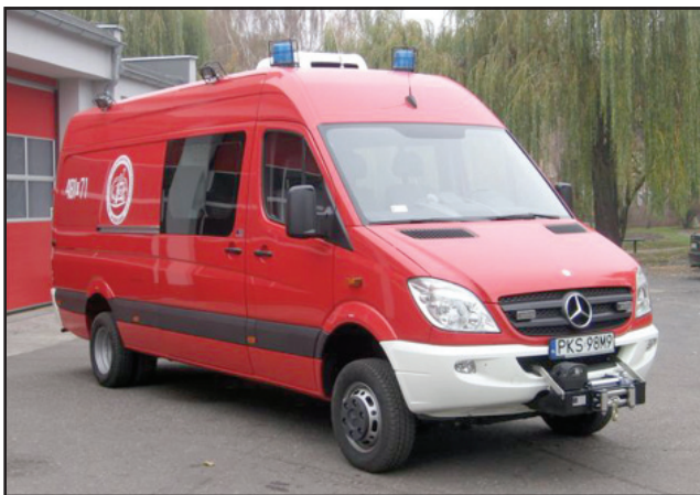
Kościańscy strażacy mają nowy lekki samochód ratownictwa wodnego i