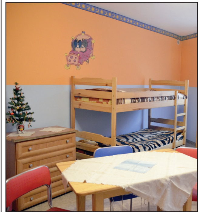
Koszt remontu Ośrodka Interwencji Kryzysowej sfinansowanego z budżetu powiatu wyniósł ok. 6 tys. złotych.