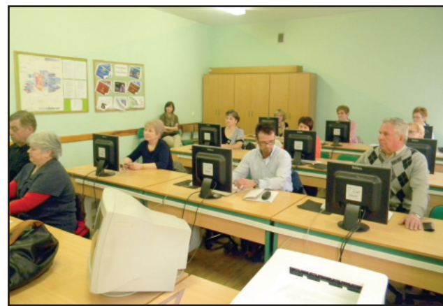
Kurs komputerowy w Starym Luboszu