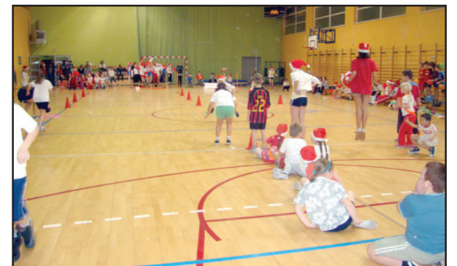
W turniejach mikołajkowych wszyscy uczestnicy otrzymali upominki

Projekt rozpoczął się 24 października br. od Dnia Walki z Otyłością. W każdej klasie specjaliści prowadzili edukację prozdrowotną. Uczniowie każdej ze szkół stworzyli ulotkę nt. zdrowego stylu życia, którą przekazywano rodzicom uczniów dla zwiększenia świadomości ich wpływu na zdrowe i dobre życie. Równoległe w szkołach prowadzony był miejski konkurs plastyczny o tematyce prozdrowotnej dla 3 poziomów edukacyjnych z atrakcyjnymi nagrodami. Finałem projektu były mikołajkowe turnieje sportowe dla 3 grup wiekowych, podczas których wszyscy, którzy wzięli udział w rozgrywkach, otrzymali upominki.