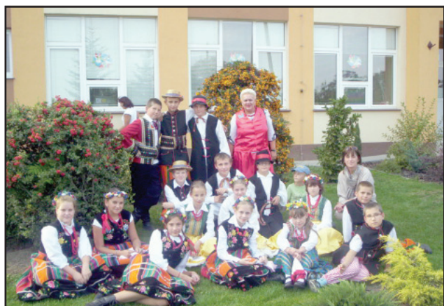
Dziecięcy Zespół Ludowy „Obrzanie” z Kielczewa