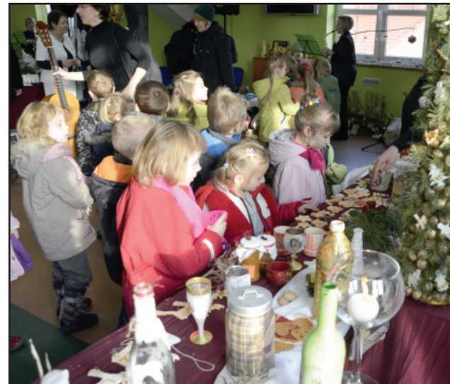
W Zespole Szkół im M. Konopnickiej w Kościanie w mikołajki, 6 grudnia, odbyła się wystawa bożonarodzeniowa.