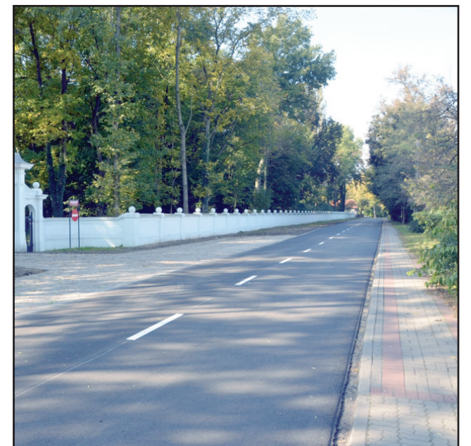
Remont drogi z Czempinia do Jerki kosztował ponad 6,7 miliona złotych.