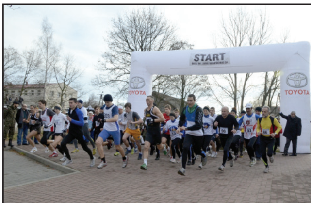
W tegorocznym biegu im. Jana Kasprowicza w Nietążkowie wzięło udział 250 biegaczy.