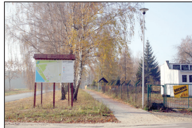
Szlak pieszo-rowerowy w Nowym Dębcu