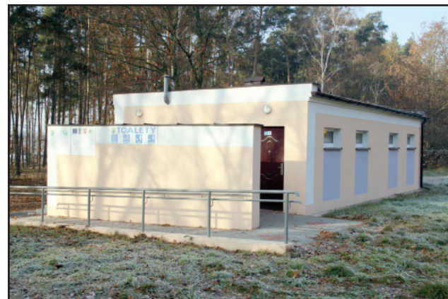
Odnowione toalety w Nowym Dębcu