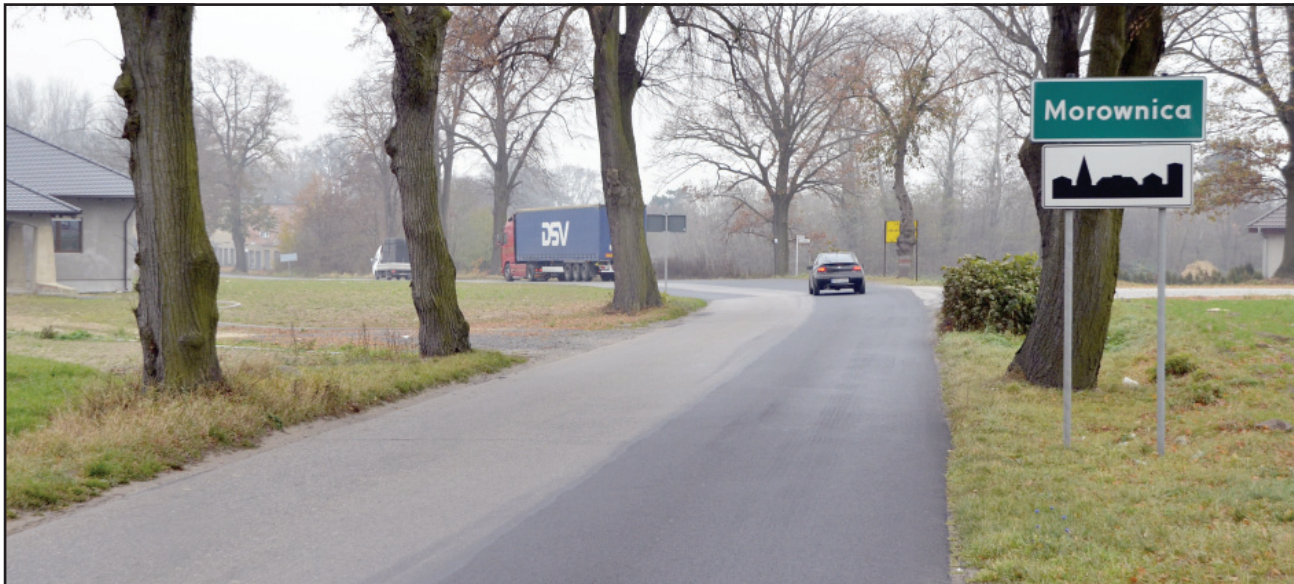
Zarząd Powiatu planuje w przyszłym roku remont drogi ze Śmigła do Machcina.