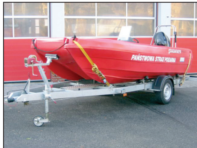
ośmioosobową łódź ratowniczą.