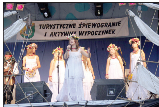
Festyn w Nowym Dębcu