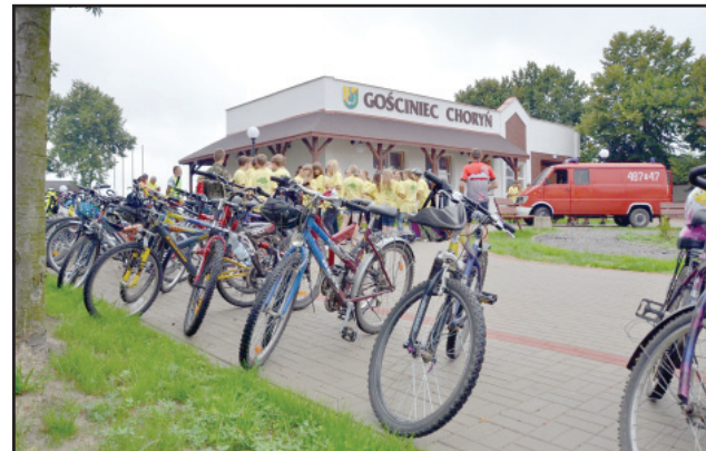
Odpoczynek w Gościńcu Choryń

Także w ramach wspomnianych środków unijnych dwa zadania realizował w minionym roku Szkolny Klub Sportowy „Jantar” w Racocie. Operacja pod nazwą „ Biegaj z nami na olimpijskim szlaku ” polegała na zorganizowaniu Wiosennych Biegów Przełajowych połączonych z Inauguracją Dni Olimpijczyka oraz Biegu Olimpijskiego - Racot 2011 i zgromadziła łącznie ponad 3 500 uczestników, którzy wzięli udział we wspomnianych imprezach. Zadanie to uzyskało dofinansowanie ze środków LGD „Gościnnia Wielkopolska” w kwocie 19 600 zł. Zadanie pod nazwą „ Muzeum pamiątek olimpijskich w Racocie ” polegało na archiwizacji fotograficznej i komputerowej pamiątek sportowych i olimpijskich zgromadzonych przez 27 lat działalności „Jantara”, wykonanie katalogu pamiątek, zaprojektowanie i wykonanie tablic zdjęciowych, zakup antyram wystawienniczych, uzupełnienie kronik działalności klubowej, przygotowanie i wydanie folderu Muzeum Pamiątek Olimpijskich w Racocie. Zadanie zostało również dofinansowane w kwocie 10 850 zł ze środków na rozwój obszarów wiejskich programu „Leader” w ramach Lokalnej Grupy Działania „Gościnnia Wielkopolska”. (up, jn, md)