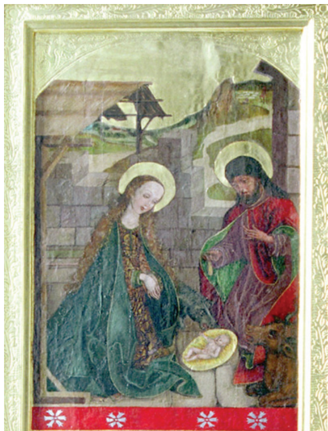
„Narodzenie Chrystusa” scena z ołtarza Zesłania Ducha Świętego w Kościele Farnym pw. Najświętszej Marii Panny Wniebowziętej

„Przyszła nareszcie chwila ciszy uroczystej, Stało się – między ludzi wszedł Mistrz – Wiekuisty”