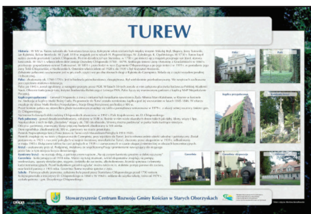
Tablica informacyjna w Turwi