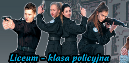
Liceum - klasa policyjna