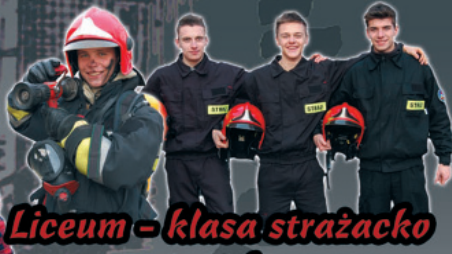
Liceum - klasa strażacko ratownicza