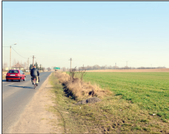
W Lubiniu, po prawej stronie od Krzywina powstanie 600-metrowy ciąg pieszo-rowerowy.