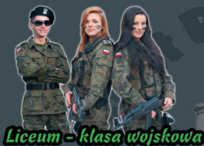
Liceum - klasa wojskowa