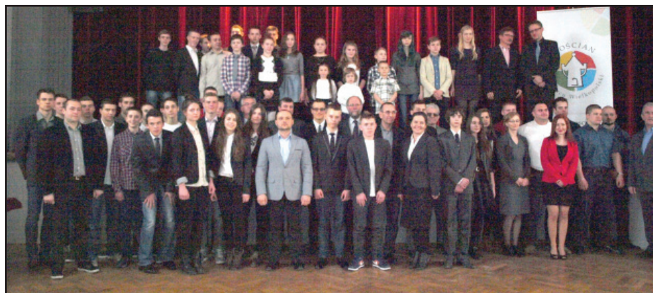
Samorząd Kościana podziękował zawodnikom i trenerom za ich osiągnięcia sportowe w 2013r.