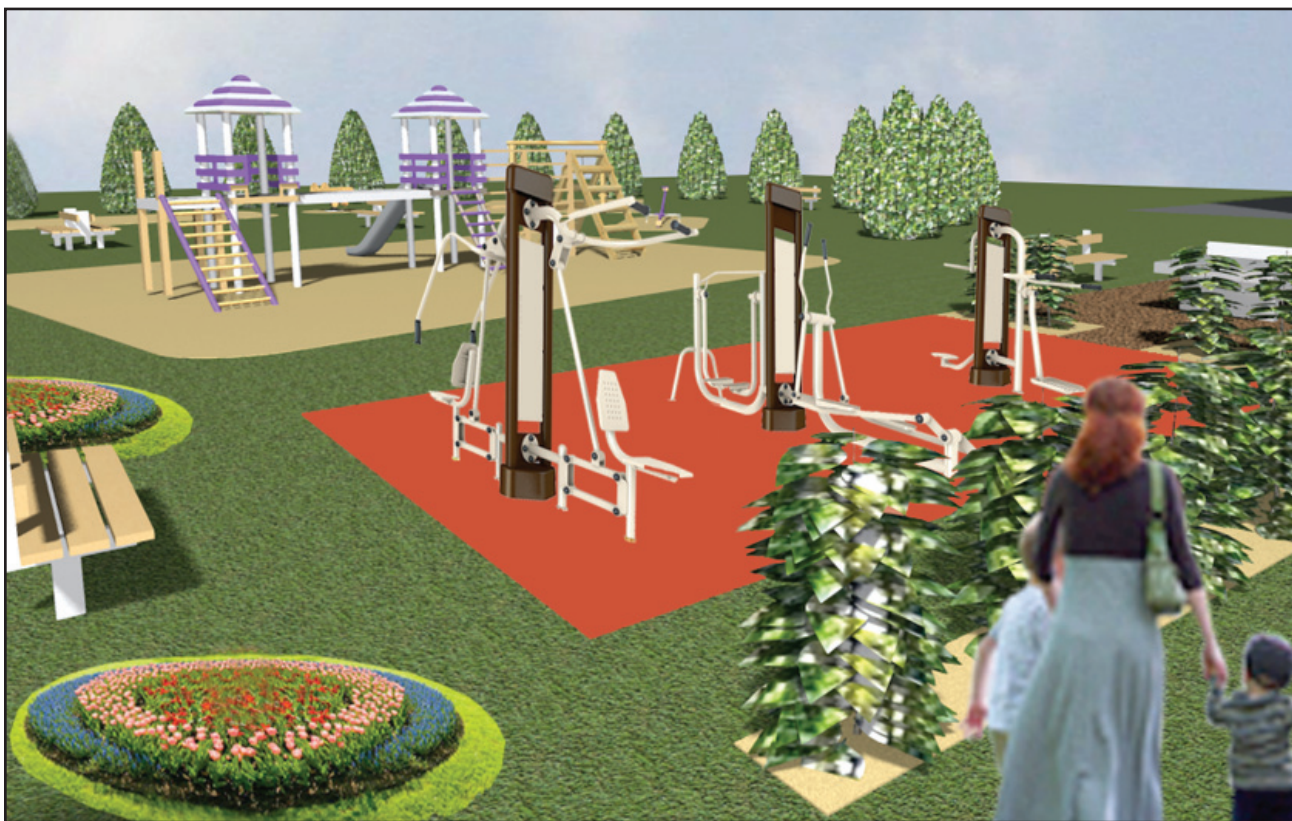
Przystań w Kokorzynie – miejsce wypoczynku i rekreacji dla mieszkańców