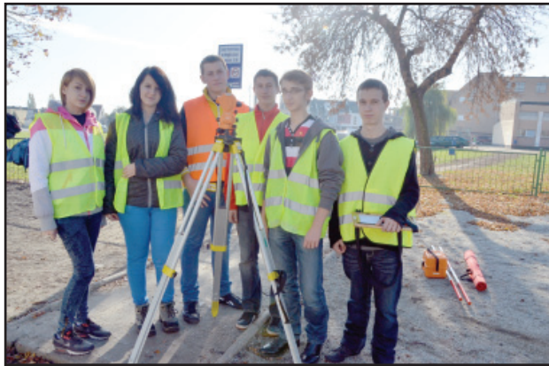
Nauka w klasie technikum geodezyjnego to szansa na dobry zawód.

Procedury przetargowe trwają także na przebudowę 483 metrów drogi powiatowej w Wieszkowie oraz 270 metrów chodnika w Zglińcu i 60 metrów chodnika w Łuszkowie. Na przebudowę dróg powiatowych na terenie gminy Krzywina powiat uzyskał dofinansowanie od samorządu tej gminy w kwocie 400 tys. złotych. hg