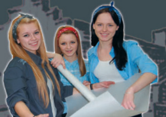
Technik architektury krajobrazu