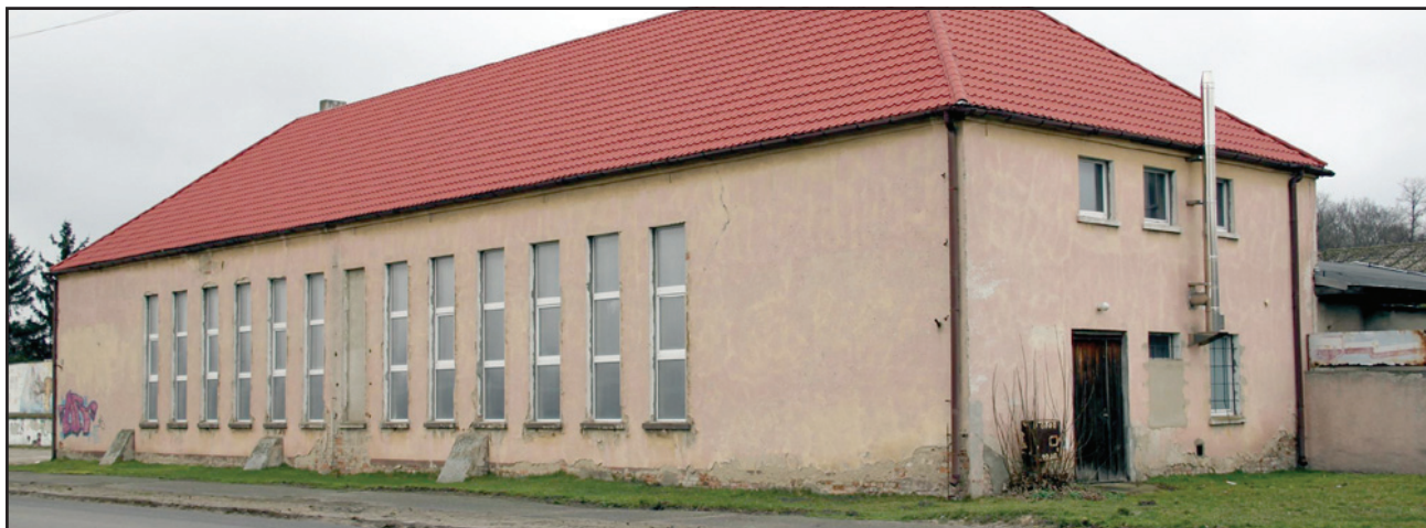
Budynek „starej” sali gimnastycznej w Racocie

Gminy Kościan ul. Młyńska 15. Przedmiotem drugiego przetargu jest zbycie działki w Racocie nr 276/3 o pow. 0,09.28 ha zabudowanej budynkiem sali gimnastycznej. Do budynku przyłączona jest sieć energetyczna, wodociągowa, gazowa i kanalizacja sanitarna. Cena wywoławcza: 147.000 zł. Przetarg odbędzie się w dniu 29.04.2014 r. o godz. 11.00 w salce Urzędu Gminy Kościan ul. Młyńska 15. Szczegóły przetargów na stronie www.gminakoscian.pl w Biuletynie Informacji Publicznej. (md)