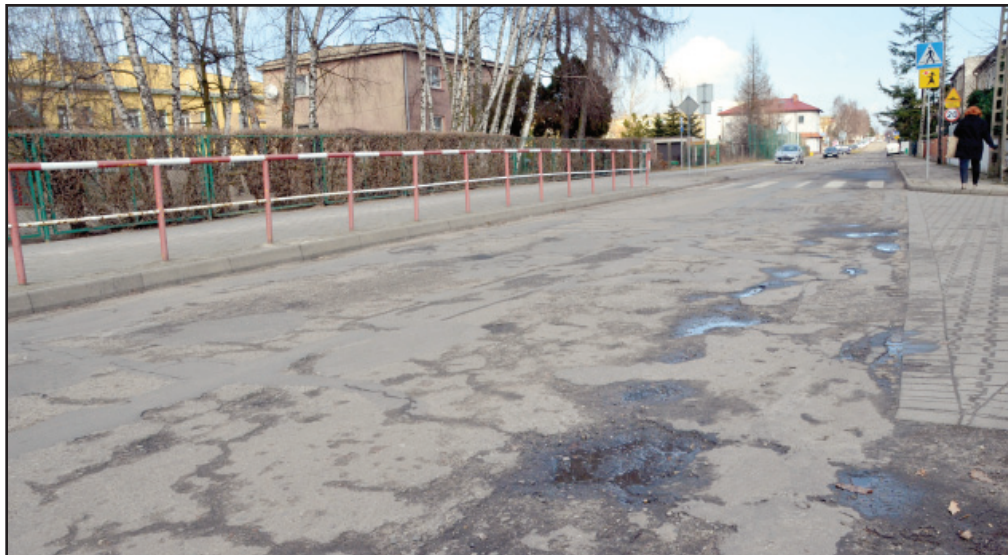
Koszt przebudowy ulicy Szkolnej w Kościanie to 573 591 złotych, kwotą 286 tys. złotych inwestycję powiatu wesprze samorząd miasta.