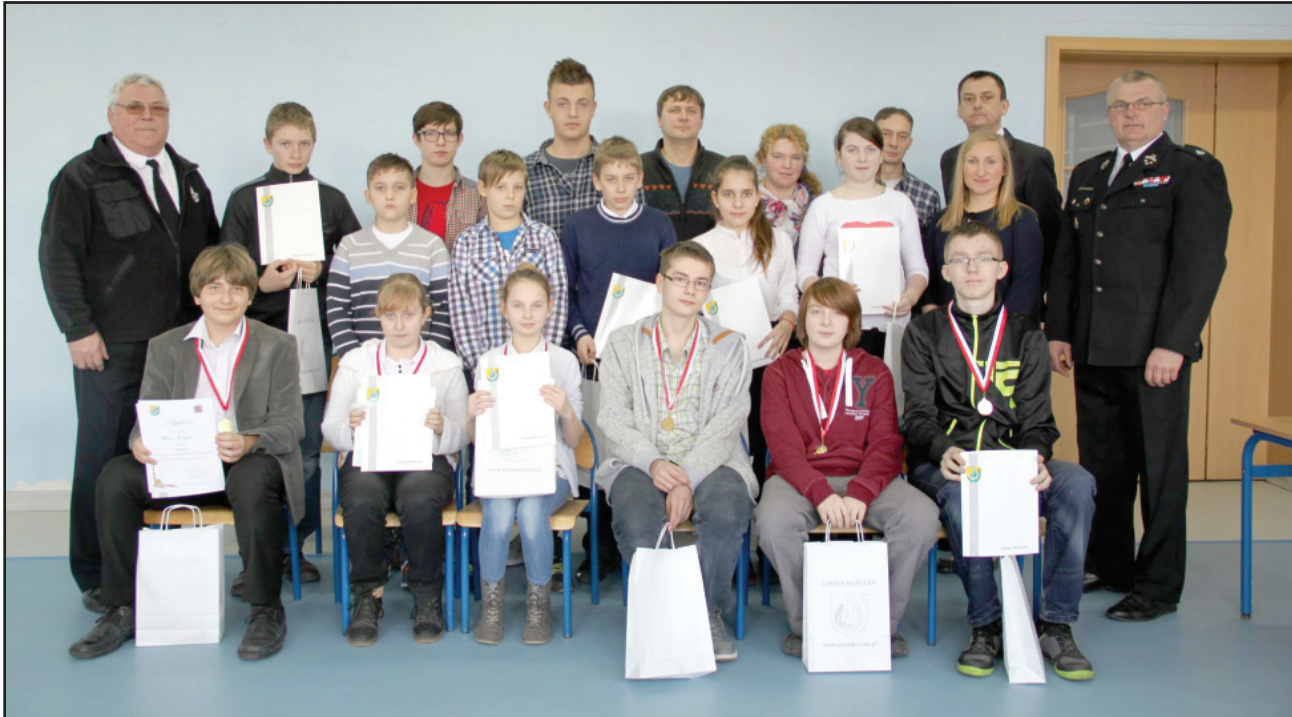
Uczestnicy Gminnego Turnieju Wiedzy Pożarniczej