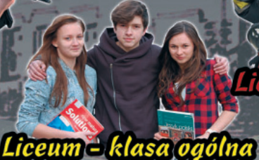
Liceum - klasa ogólna