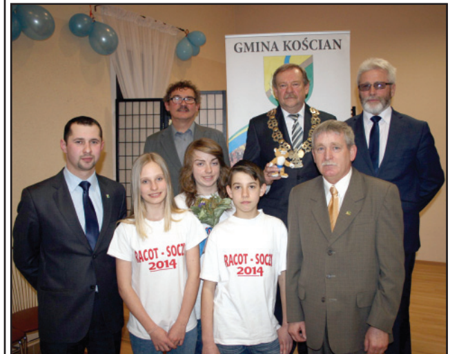
Uczestnicy wyjazdu podczas Sesji Rady Gminy Kościan