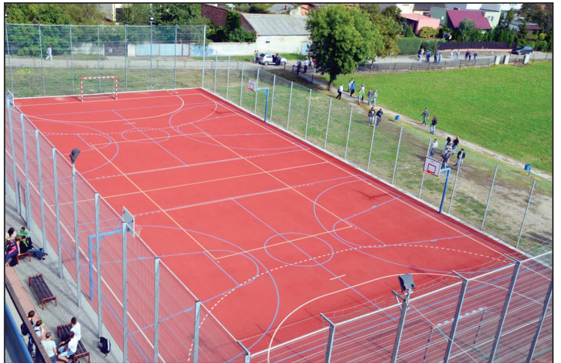
Hala powstanie przy niedawno zbudowanym boisku.

może uzyskać, bez względu na wartość inwestycji. Biorąc pod uwagę charakter obiektu zakładamy, że uzyskanie dotacji w takiej wysokości jest możliwe - zaznaczył starosta. - Pozostałe cztery miliony chcielibyśmy sfinansować wspólnie z miastem Kościanem. Wspomniana kwota w 50% byłaby finansowana z budżetu miasta, a w pozostałych 50% z budżetu powiatu. W każdym roku realizacji tej inwestycji samorządy przekazałyby na ten cel po milionie złotych. Oczekiwanie władz miasta Kościana przy realizacji tej wspólnej inwestycji - podkreślił starosta Jęcz - było takie, że ten nowy obiekt będzie miał charakter hali widowiskowo-sportowej. Ze względu na to sala będzie miała powiększoną - w stosunku do istniejącego projektu - widownię. Nowy projekt zakłada