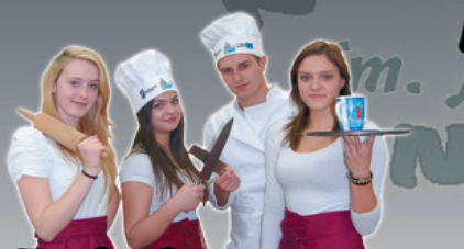
Technik żywienia i usług gastronomicznych