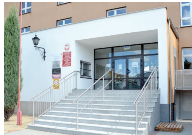
Nowe schody przy ZSP w Kościanie wykonano z granitu, a poręcze ze stali nierdzewnej.