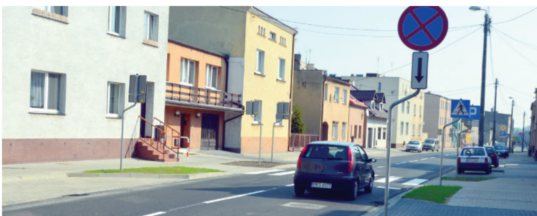
Koszt przebudowy ulicy Wielichowskiej to ponad 1 mln 600 tys. złotych. Inwestycję wsparł samorząd Miasta Kościana.

Zakończono prace remontowo-budowlane na ulicy Wielichowskiej w Kościanie. Remont był wspólną inwestycją Powiatu Kościańskiego i Miasta Kościana.