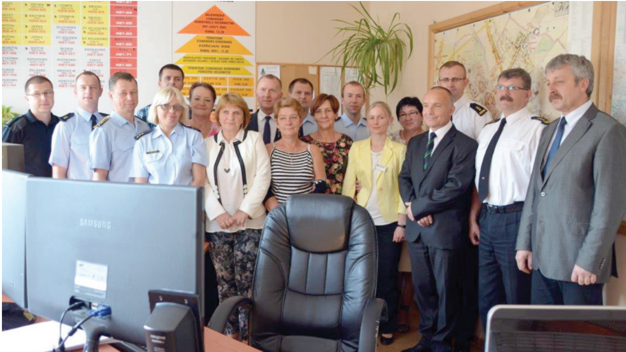
Od 2010 roku służbę w Zintegrowanym Stanowisku Dyspozytorskim pełniło 10 osób.