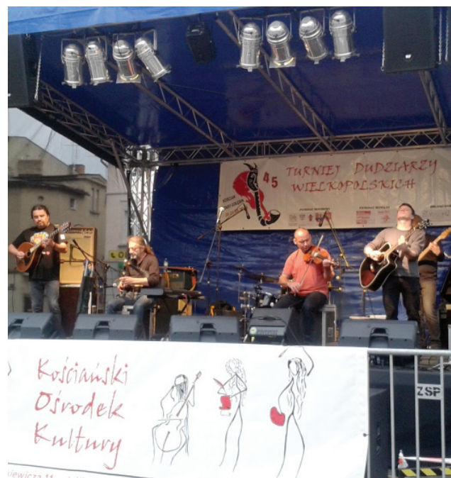
Gość turnieju Carrantuohill