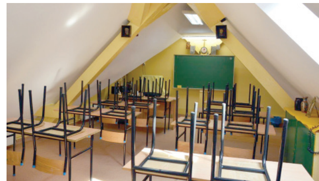
Dzięki zmianie układu sal lekcyjnych uczniowie ZSS w Kościanie zyskali dwa przestronne pomieszczenia

Orędownik Samorządowy. Pismo informacyjne. Redagują Starostwo Powiatowe w Kościanie, Urząd Miejski w Kościanie, Urząd Gminy w Kościanie. Redaktor naczelna - Jolanta Napierała. Wydawnictwo AGA w Kościanie, ul. Wrocławska 6. Druk: Drukarnia Prasowa Polskaspresse, Skórzewo, ul. Malwowa 158. Nakład 8 tys. egz. Powiat: 65 512 08 25; e-mail: powiatkoscian@post.pl; Internet: www.powiatkoscian.pl Miasto: 65 512 11 11; e-mail: koscian@koscian.pl; Internet: www.koscian.pl Gmina: 65 512 10 01; sekretariat@gminakoscian.pl; Internet: gminakoscian.pl