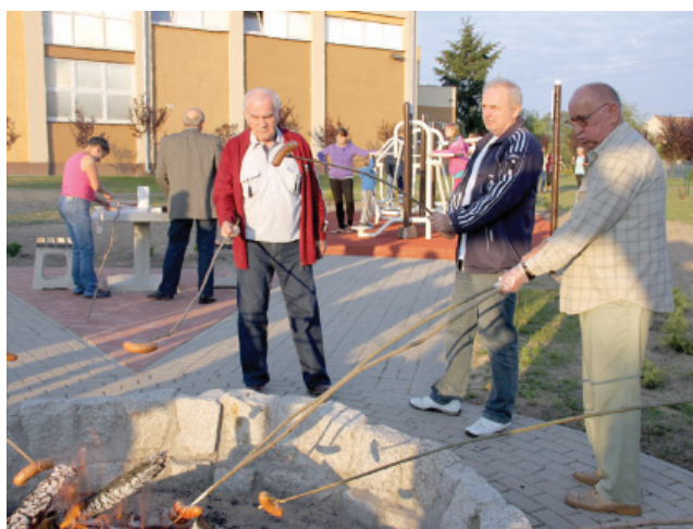
Otwarcie miejsca rekreacji w Turwi