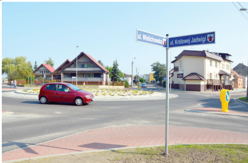
... które skomunikowało wszystkie ulice.