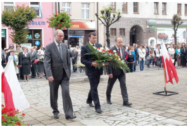
Przedstawiciele samorządu Kościana złożyli wiązanki kwiatów pod Tablicami pamięci przy Ratuszu