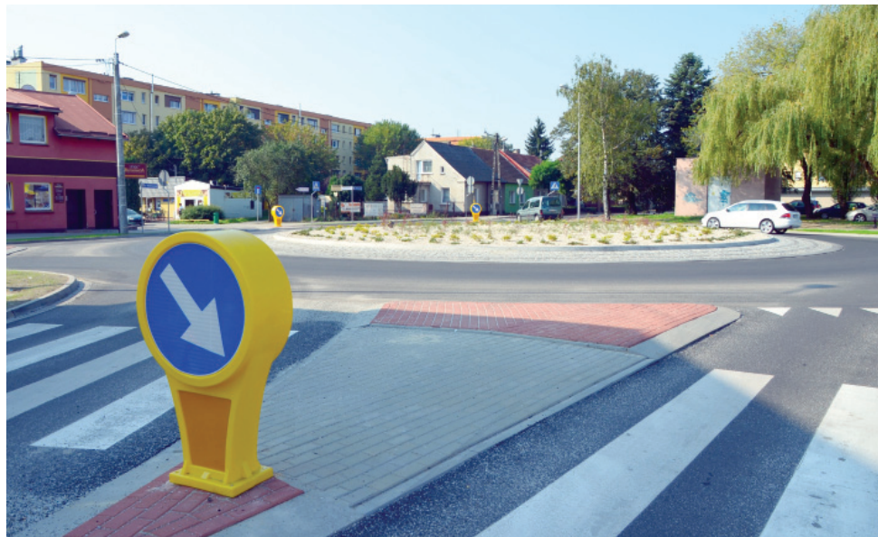
Na skrzyżowaniu ulic Wielichowskiej, Kaźmierczaka, Piaskowej i Królowej Jadwigi zbudowane zostało duże rondo...