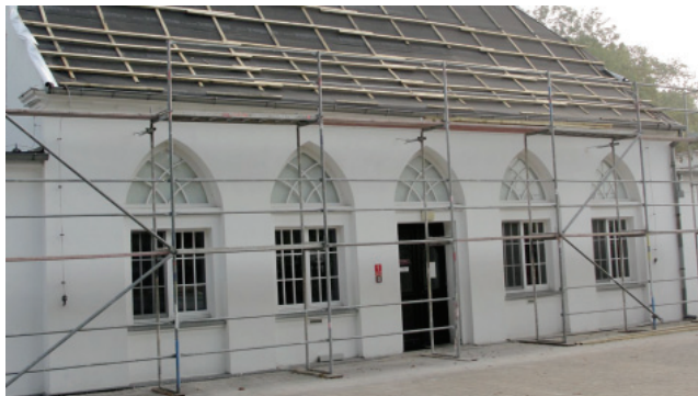
Remont dachu na Domu Ogrodnika w DPS w Jarogniewicach potrwa do końca września