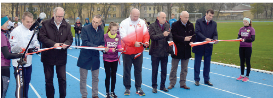
Gość honorowy, olimpijczyk, lekkoatleta Szymon Ziółkowski chwalił nowo otwarty kompleks lekkoatletyczny przy stadionie miejskim w Kościanie

Niedawno stadion lekkoatletyczny w Kościanie otrzymał certyfikat Polskiego Związku Lekkiej Atletyki. W ramach modernizacji wybudowana została bieżnia dookólna o długości czterystu metrów, bieżnia przystosowana do skoku w dal, do skoku wzwyż oraz rzutnia lekkoatletyczna. Na obiekcie zainstalowano również oświetlenie, które pozwoli na treningi w godzinach wieczornych. Stadion ma służyć mieszkańcom Kościana, jak i okolicznych gmin. Koszt inwestycji to 2.300.000 zł.