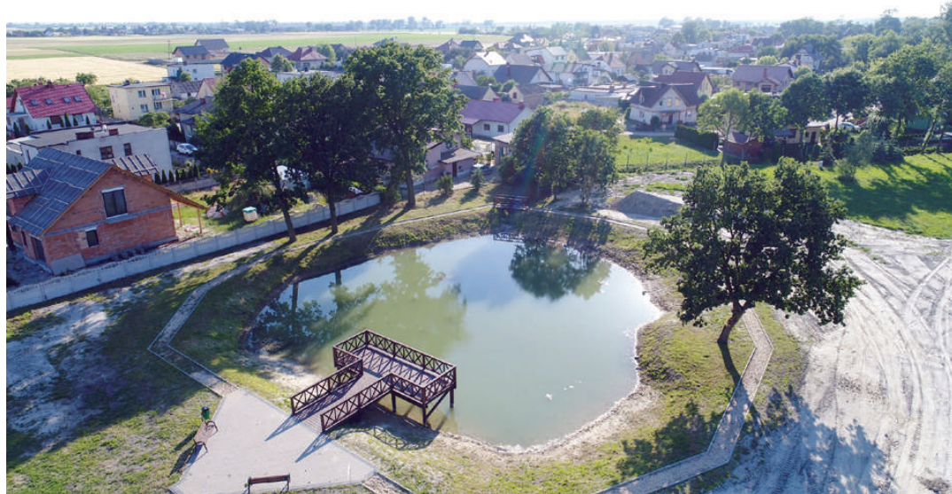
Uroczysko nad sadzawką w Starych Oborzyskach