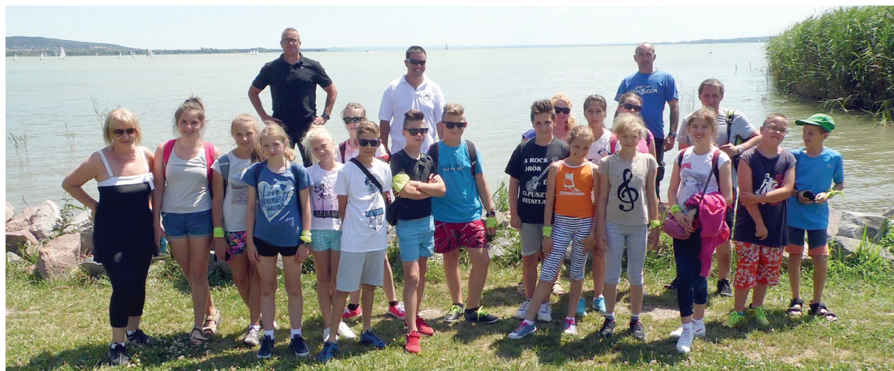
Obozowicze nad Balatonem

mie lipca i sierpnia zostanie rozebrany przepust ceglany w ulicy Wodnej w Racocie. Przebudowa potrwa do września 2016 r. Sugerujemy dojazd do posesji przez Darnowo. Za powstałe utrudnienia serdecznie przepraszamy.