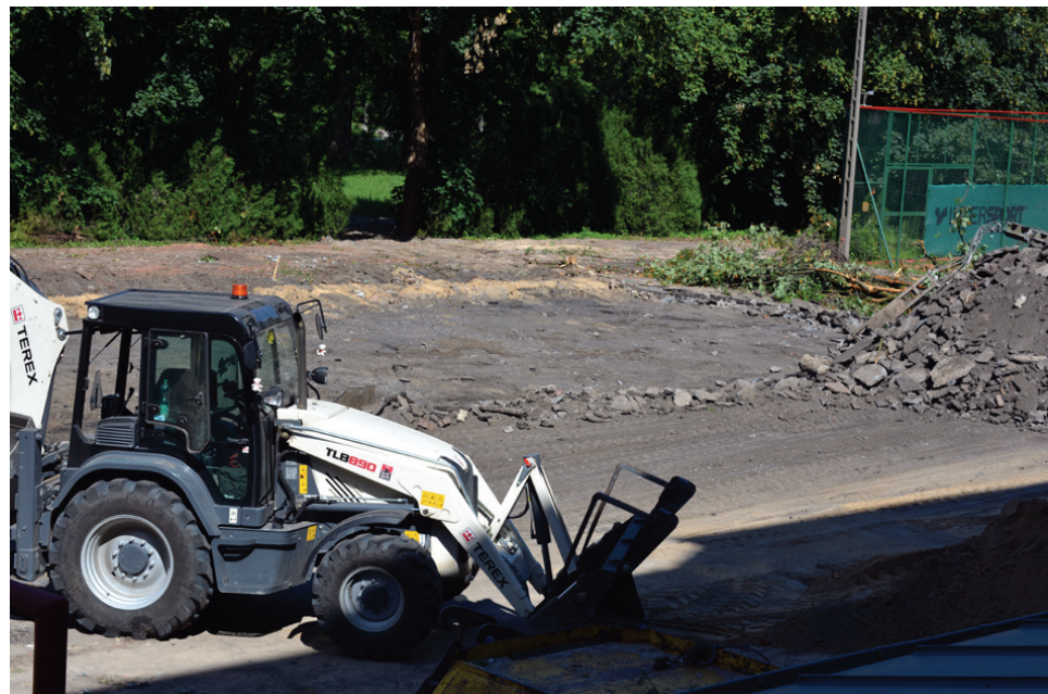
Budowa kanalizacji deszczowej na terenie ILO