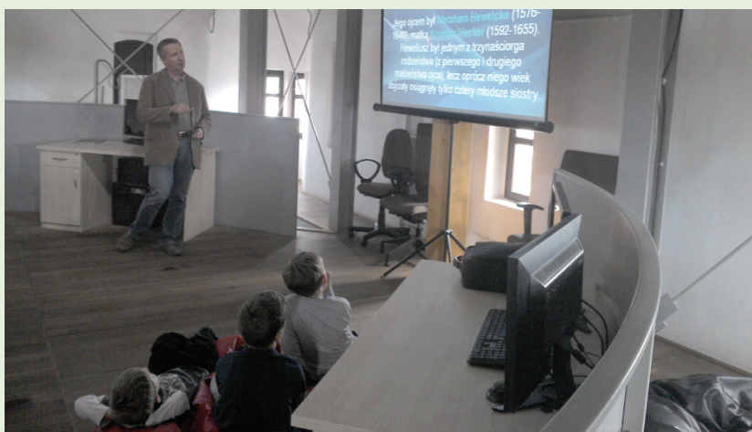
O gdańskim astronomie w kościańskim obserwatorium astronomicznym