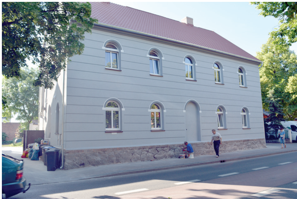
Nowy wygląd budynku – al. Kościuszki 25