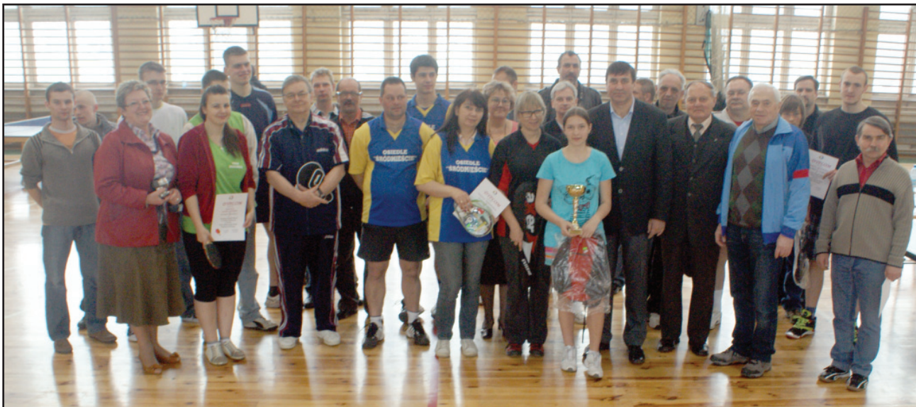
Uczestnicy i zwycięzcy turnieju tenisa stołowego z os. Wolności

Osiedle Konstytucji 3 Maja nie wzięło udziału w rozgrywkach.