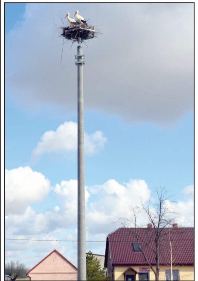
Zarząd Dróg Powiatowych sfinansował budowę słupa i platformy na bocianie gniazdo.