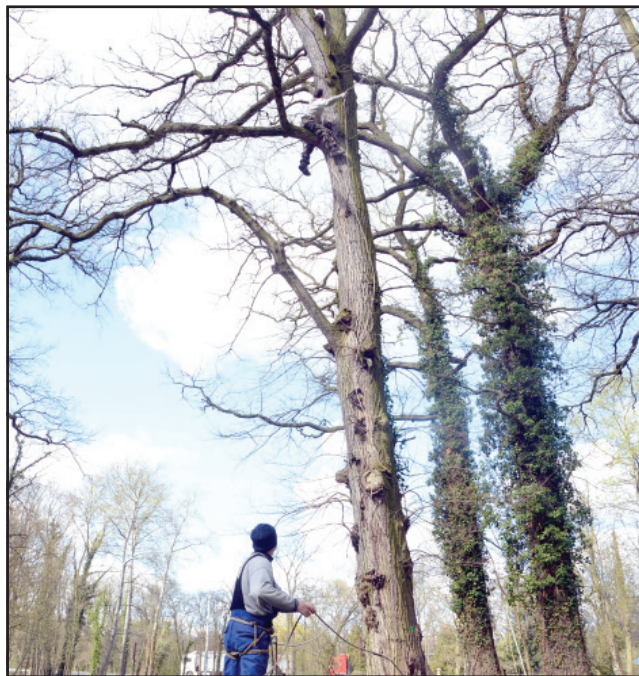
Fachowcy o alpinistycznych umiejętnościach wycinali gałęzie

Obecnie prowadzone są przez profesjonalistów - wymagające alpinistycznych umiejętności - prace pielęgnacyjne w koronach drzew. Prace polegają na wycinie suchych i połamanych gałęzi. bj