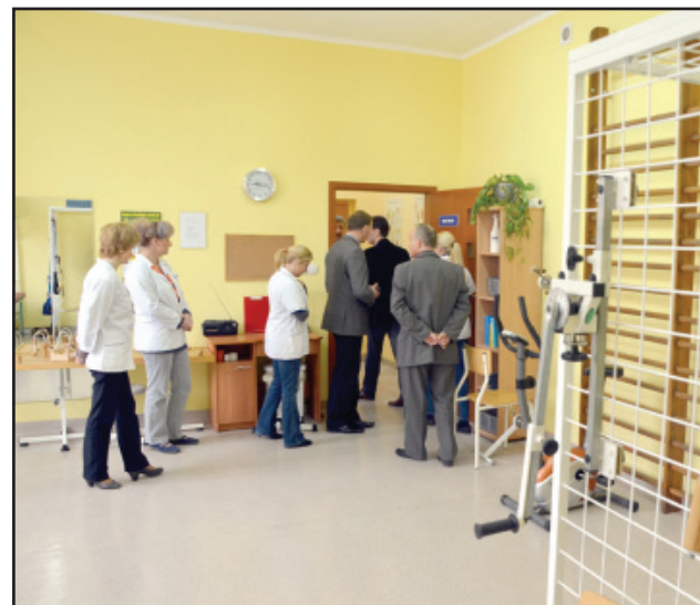
Starosta Kościański spotkał się z pracownikami śmigiełskich poradni w piątek 20 kwietnia.

Pracownie będą czynne od poniedziałku do wtorku w godzinach od 8.00 do 18.00, a od środy do piątku w godzinach od 7.00 do 17.00. bj