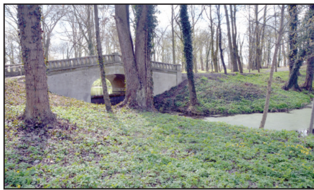
W parku w DPS wycięto podszyt i usunięto chore drzewa.