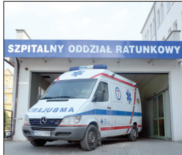
Od nowego roku – według zapewnień Wojewody Wielkopolskiego – karetka ratunkowa będzie stacjonowała w Krzywiniu.

Jeszcze przed kwietniowym spotkaniem w urzędzie wojewódzkim Starosta Kościański po czteromiesięcznym oczekiwaniu na odpowiedź od Ministra Zdrowia w sprawie karetki w Krzywiniu otrzymał pismo, w którym ministerstwo – wbrew wcześniejszym interpretacjom przepisów – informuje że „... w przypadku kiedy Wojewoda dokona analizy funkcjonowania zespołów ratownictwa medycznego (liczba interwencji, czasu dojazdu) w nowym układzie organizacyjnym i złoży do akceptacji Ministra Zdrowia aktualizację Planu (Ratownictwa Medycznego) ujmującą konieczność dokonania kolejnych zmian, Minister Zdrowia rozważy zatwierdzenie przedmiotowej aktualizacji”. Dalej w piśmie czytamy, że „niezależnie od powyższego informuje, iż osta-