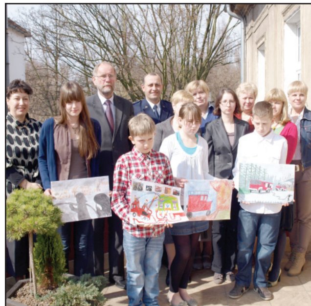
Finaliści plastycznego konkursu strażackiego z opiekunami i organizatorami

Zastrzega się prawo odwołania przetargu lub jego unieważnienia w przypadku zaistnienia ważnych przyczyn.