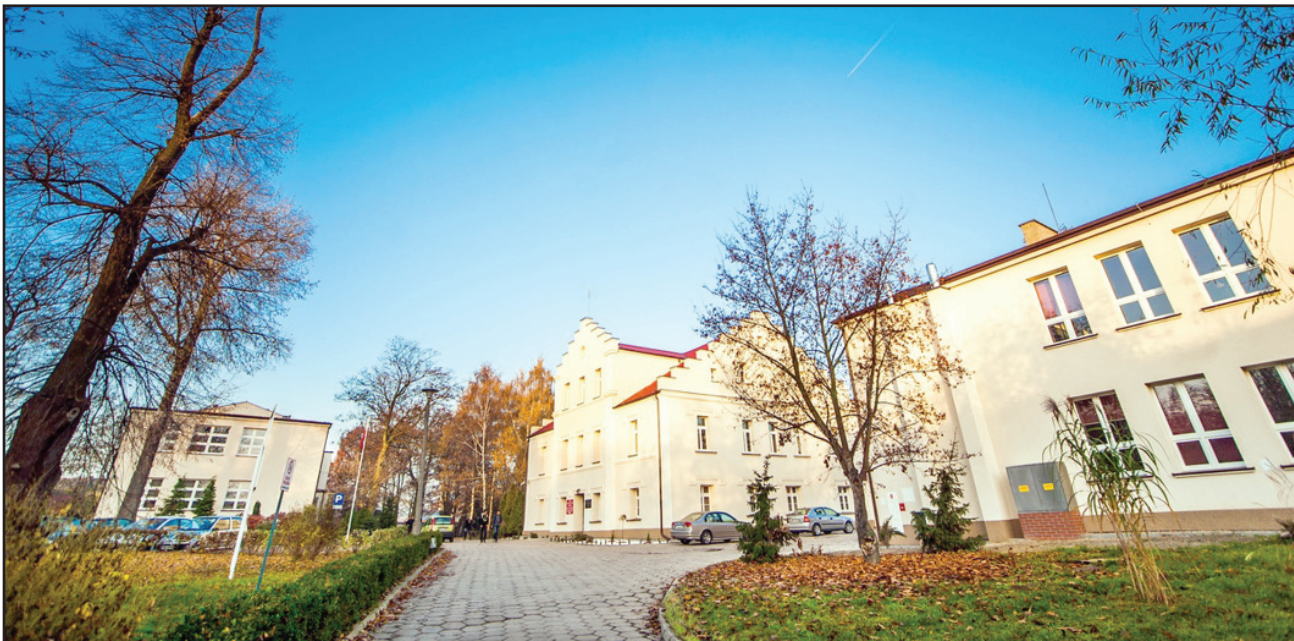
Szkoła w Nietążkowie ma nową, ciekawą ofertę dla gimnazjalistów.

Wiedza i umiejętności, jakie zdobędzie absolwent klasy policyjnej, pomogą mu w podjęciu pracy w policji, innych służbach mundurowych lub firmach związanych z ochroną osób i mienia. ZSP