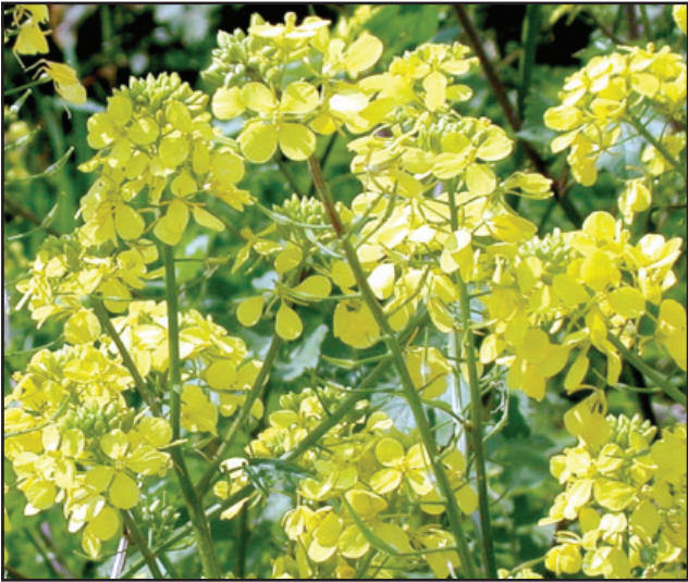
Starostwo planuje zakup ziarna na poplony.