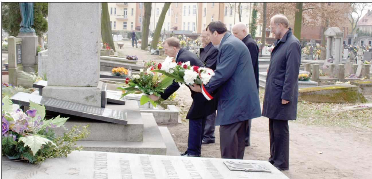
Przedstawiciele samorządów miasta, gminy i powiatu Kościańskiego oddali hołd poległym na wschodzie oficerom polskim składając kwiaty pod Krzyżem Katyńskim