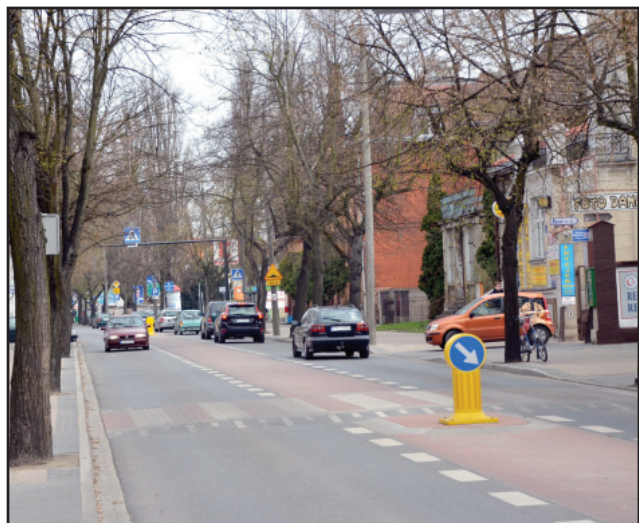
W powiecie wzrasta ilość samochodów.

Zwiększyła się również liczba jednoślądów. Porównując rok 2010 z rokiem 2011 liczba zarejestrowanych motocykli wzrosła o 118, a liczba motorowerów wzrosła o 529. W ramach ciekawostki informujemy, że w naszym powiecie zarejestrowanych jest 36 cystern, 422 wywrotki oraz 77 chłodziń i lodowni. am