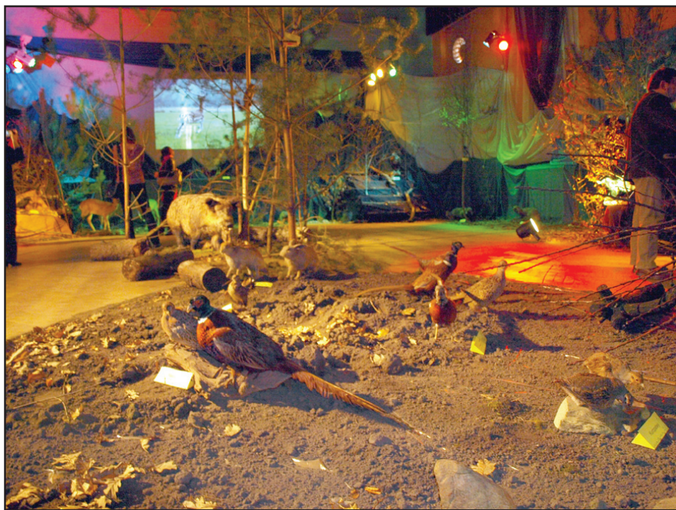
Sala KOK na kilka dni zmieniła się w las z dzikimi zwierzętami