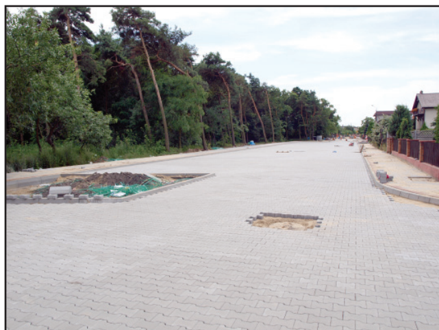
Przy ul. Dąbrowskiego usytuowanych będzie 25 nowych miejsc postojowych w okolicy cmentarza