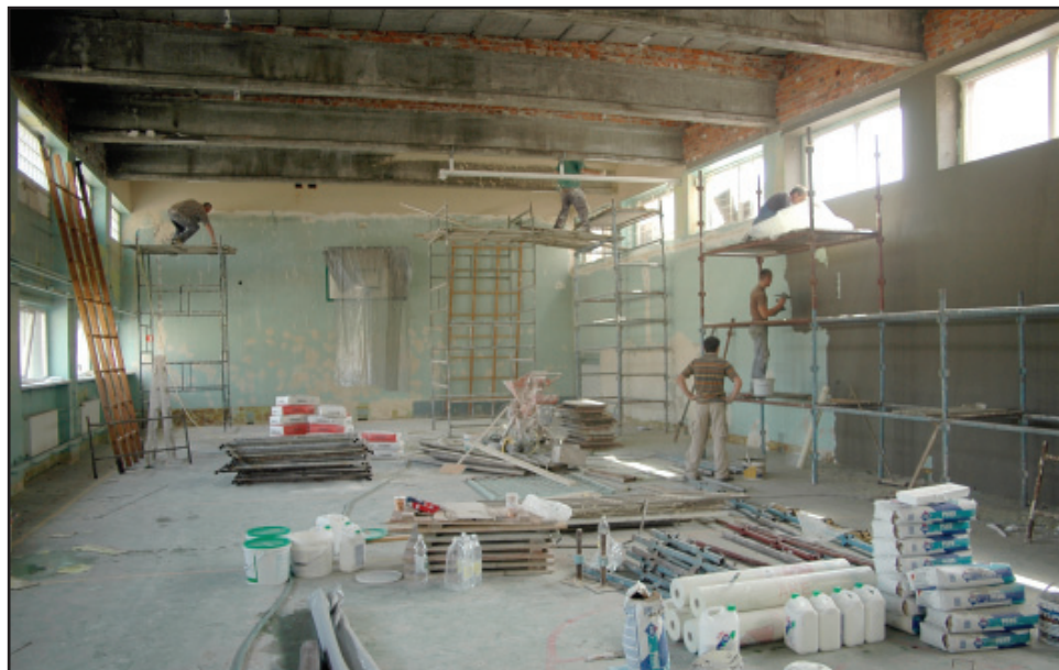
Remont sali i siłowni będzie kosztował 220 tys. złotych.