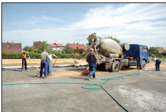
Boisko będzie gotowe w nowym roku szkolnym.

rach 44 m x 22 m. Będzie przystosowane do gry w piłkę nożną, siatkową, koszykówkę. Koszt inwestycji to 600 tys. złotych. Równocześnie w szkole jest prowadzony remont sali gimnastycznej i siłowni. Koszt prac, które zakończą się przed końcem wakacji to kwota 220 tys. złotych.