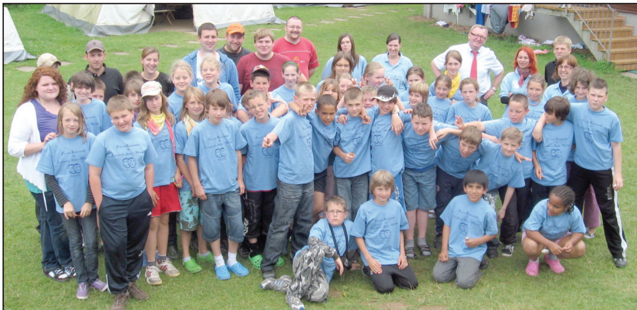
Uczestników biwaku odwiedził Ernst Walter Görisch, starosta powiatu Alzey-Worms.