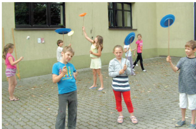
Podczas lipcowych zdjęć warsztatowych teatralno-kuglar-skich dzieci uczyły się m.in. żonglowania talerzami