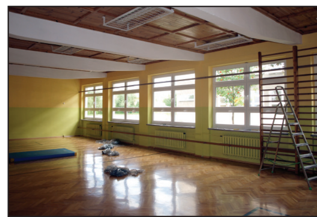
W Zespole Szkół nr 3 gruntownie modernizowane są m.in. obie sale gimnastyczne

najmłodszych wydzielone drzwiami z PCV i gruntownie wyremontowane zostanie II piętro budynku wraz z korytarzem - remont podłóg, malowanie ścian sal i korytarza, wymianę drzwi w salach lekcyjnych, położenie na korytarzu płytek antypoślizgowych, do jednej z sal zakupione zostaną także meble. W Zespole Szkół nr 3 gruntownie remontowane są obie sale gimnastyczne – wymienionych jest 15 okien, cyklinowany i lakierowany jest parkiet, ściany sal oraz szatni i sanitariatów - malowane, trwa także częściowa termomodernizacja budynku oświatowego, czyli wymiana 135 okien oraz remont 1.600m 2 pokrycia dachowego wraz z ociepleniem na dwóch sektorach, łącznikach oraz sali sportowej. W Zespole Szkół nr 4 w wakacje powstaje boisko do siatkówki plażowej, wymieniane są posadzki w 8 salach lekcyjnych, malowane są ściany tych sal oraz korytarze budynku, salka gimnastyczna, jak również pomieszczenia sanitarno-żywnieniowe, a w większości sal uzupełniane jest oświetlenie. W I Liceum Ogólnokształcącym, oprócz zaplanowanej do końca wakacji wymiany stolarki okiennej, wykonywane są renowacje sal lekcyjnych i mebli, modernizacja stołówki szkolnej oraz zagospodarowanie boiska do badmintonu.