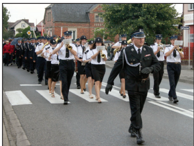
Przemarsz strażaków i delegacji

Ochotnicza Straż Pożarna w Racocie to najprężniej działająca jednostka zarówno na terenie gminy Kościan jak i powiatu kościańskiego. W tym roku mija dokładnie 75 lat od powstania jednostki. Z tej okazji w sobotnie popołudnie, 4 lipca 2009r. strażacy z Racotu obchodzili