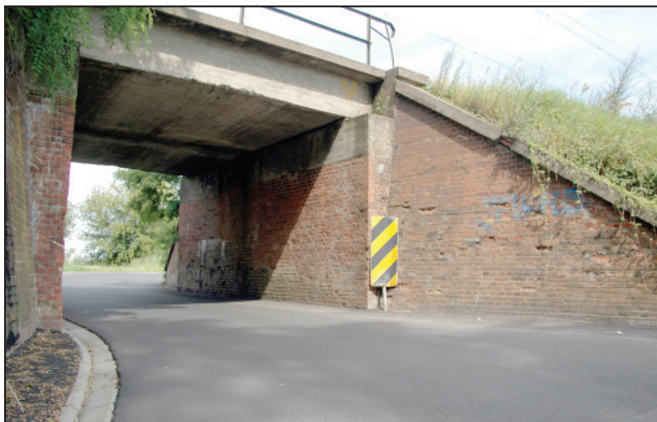
Zarząd Dróg Powiatowych w Kościanie zakończył modernizację nawierzchni pod wiaduktem w Widziszewie.