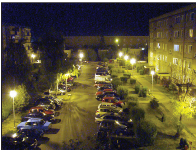
Nowe energooszczędne oświetlenie jest ustawiane na osiedlu Jagiellońskim w mniejszych odstępach