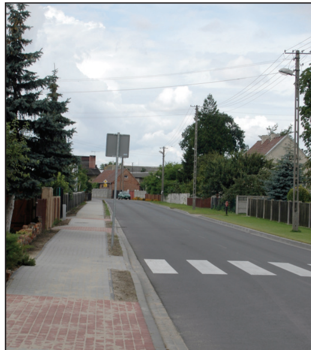
W Łuszkowie wyremontowano chodnik. Koszt prac ponad 57 tys. złotych.

Poza inwestycjami na drogach prowadzone są remonty w szkołach. Trwa budowa boiska przy Zespole Szkół Ponadgimnazjalnych w Kościanie. Boisko będzie miało poliuretanowo – gumową nawierzchnię o wymia-