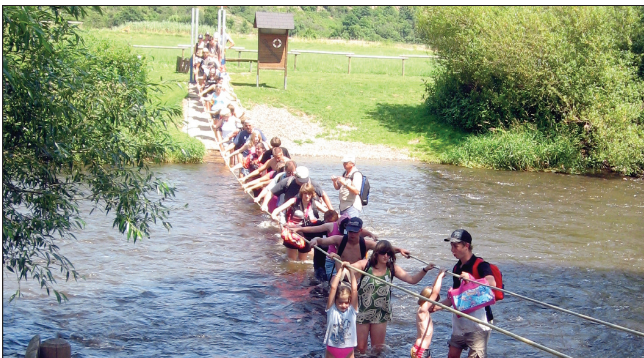
Przeprawa przez rzekę zapadła na długo w pamięci.