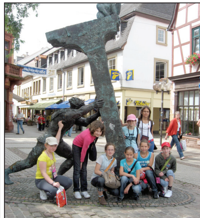
Dzieci odwiedziły Alzey.

Apteka dyżurująca jest czynna w czasie, kiedy nie są otwarte inne apteki na terenie Miasta Kościana.