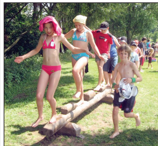
W Bad Sobernheim było wiele przeszkód do pokonania.