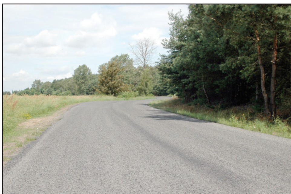
W Wieszkowie koszt prac wyniósł ponad 202 tys. złotych.