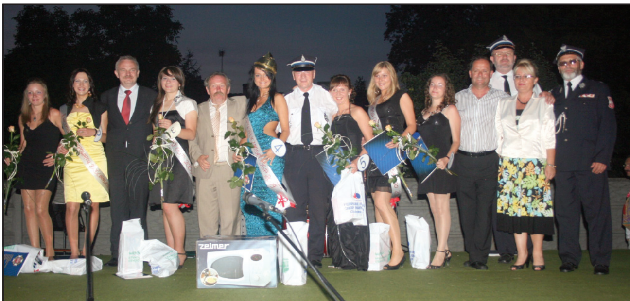
Miss OSP w otoczeniu konkurentek i jurorów