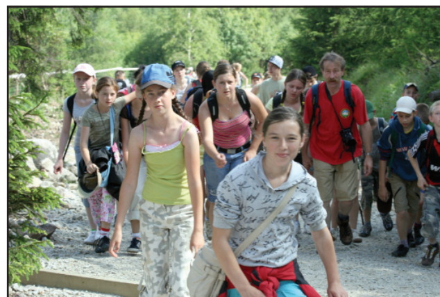
W drodze na Śnieżkę.

Czterdziestoosobowa grupa młodzieży z Gminy Kościan wypoczywała w terminie 29 czerwca do 9 lipca na obozie integracyjnym w Ściegnach koło Karpacza. Młodzież w czasie pobytu miała okazję podziwiać krajobraz i atrakcje turystyczne Kotliny Jeleniogórskiej, Karkonoszy i Rudaw Janowickich. Bogaty program obejmował wycieczki górskie m.in. na Śnieżkę, Pielgrzymy, Grabowiec, Wodospad Kamieńczyk i Chojnik, zwiedzanie Jeleniej Góry, Karpacza, Szklarskiej Poręby i Miłkowa, wstępy do Świątyni Wang w Karpaczu, Parku Miniatur w Kowarach, Western City w Ściegnach, podziwianie parady motocykli marki Harley Davidson i korzystanie z toru saneczkowego w Karpaczu, zajęcia sportowe na miejscowym boisku Orlik 2012 oraz wiele innych zajęć integracyjnych i kulturalnych. Całkowity koszt wyjazdu został pokryty z budżetu Gminnej Komisji Profilaktyki i Rozwiązywania Problemów Alkoholowych. (md)