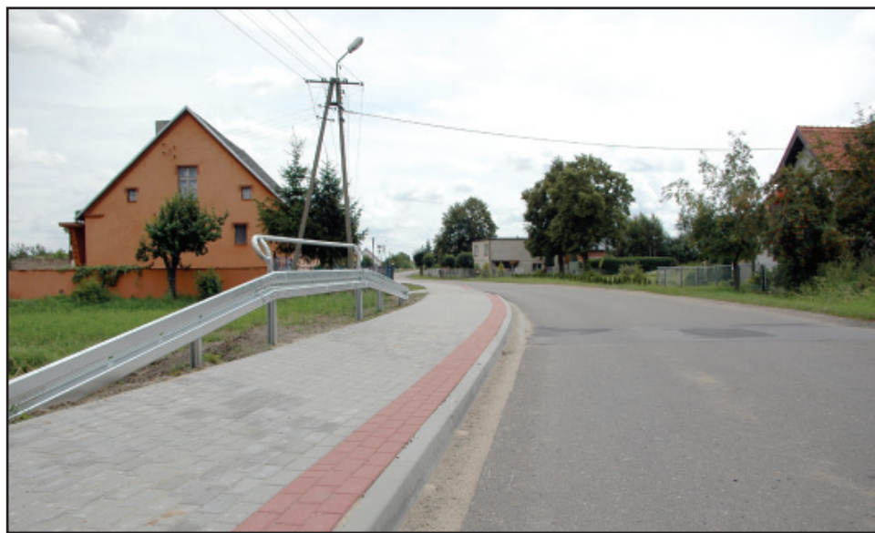
W Darnowie wyremontowano chodnik. Płytki chodnikowe podpisały dzieci biorące udział w organizowanym przez sołectwo pikniku.

W drugim, prowadzonym przez powiat Zespole Szkół Ponadgimnazjalnych w Nietążkowie są wymieniane okna. Wymiana 32 okien w budynku „B” szkoły będzie kosztowała ponad 40 tys. złotych. bj