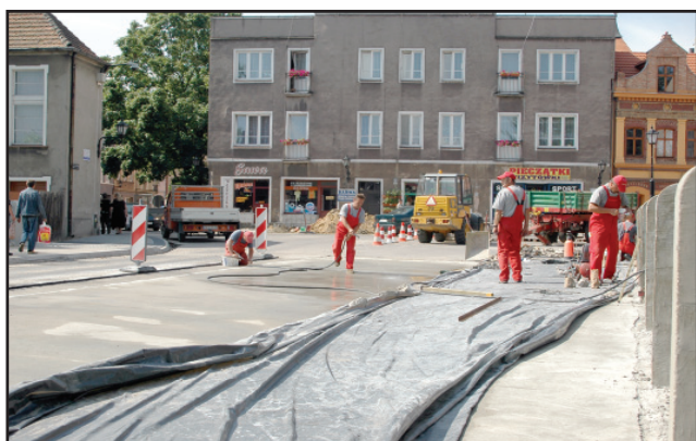
Remont mostu i ul. Piłsudskiego to największa tegoroczna inwestycja Powiatu Kościańskiego w mieście Kościanie.